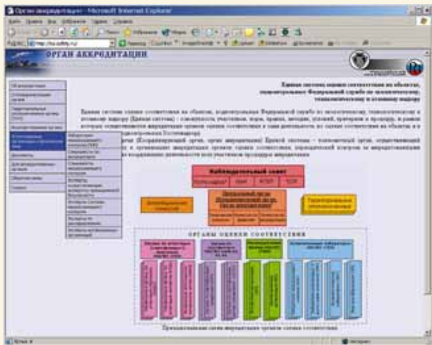
Рис. 3. Сайт Центрального (координирующего) органа ЕС ОС

Кроме того, на сайте действует интерактивный интернет-форум ( http://forum.safety.ru ), на котором обсуждаются вопросы информатизации территориальных органов Ростехнадзора и аккредитованных в ЕС ОС организаций, использования компьютерных программ, разработанных НТЦ «Промышленная безопас-