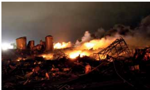
▲ Рис. 1. Авария на складе минеральных удобрений компании WFC (17 апреля 2013 г.)

Эта крупная промышленная авария привлекла внимание американских и мировых средств массовой информации (СМИ). Любая авария не только трагическое событие, но и очередное напоминание о реальности техногенных угроз, и самое главное — это фактологическая база, используемая для анализа причин и ответов на вопросы: из-за чего произошла авария? что необходимо сделать, чтобы миними-